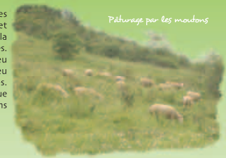
Pâturage par les moutons

L'exploitation traditionnelle des coteaux (vergers, vignes et pâturage) a longtemps maintenu la végétation basse des pelouses sèches. Puis, considérés comme peu rentables, ils sont peu à peu abandonnés au cours du XIXèmes. Plus entretenue, la végétation évolue alors vers la friche, nettement moins riche en espèces.